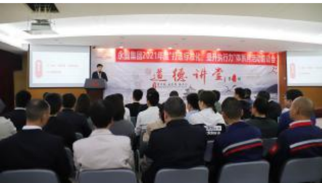
▲“体系月”启动会现场

本期讯(雷美芳) 为提升管理体系在公司经营活动中的指导作用,规范制度和体系流程在工作中的应用,顺应信息化与工业化融合发展的大格局,4月12日,永固集团2021年度“体系月”活动启动会在行政楼7楼会议室召开,集团二级科室管理以上人员及相关行政人员参加了启动会。