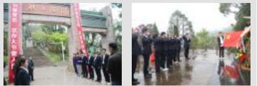
▲党员们聆听革命历史

活动结束后,大家纷纷表示要继承和发扬革命先烈的光荣传统和爱国主义精神,时刻牢记党员的身份和责任,传承红色基因,认真履职尽责,发挥党员先锋模范作用,扎实推进公司各项工作顺利开展,为建设“百年永固”增砖添瓦,为实现中华民族伟大复兴贡献力量。