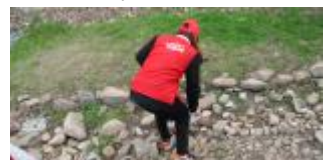
▲志愿者在公园捡拾垃圾

通过一系列活动,永固青年志愿者们用实际行动弘扬了社会主义核心价值观,培养了无私奉献的雷锋精神,践行了永固“幸福为社会”的使命。