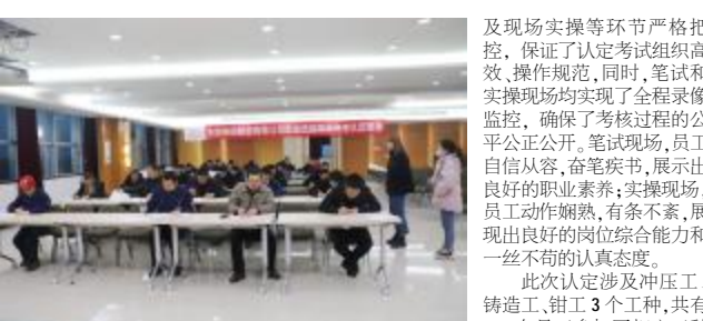
▲职业技能等级认定笔试现场

本期讯(雷美芳) 为更好提高员工技能水平,增强公司人才梯队建设,通过“以考促学,以学促用”,帮助广大一线技能人员提升岗位技能和业务素质,永固集团于3月10日-3月22日组织开展了2021年第一批职业技能等级认定工作。