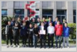
▲“最佳推行部门”质量管理部

本期讯(刘峰)为使永固不断发展和壮大,充分发挥全体员工的智慧和力量,群策群力,集思广益,共同激活企业发展“源动力”,实现