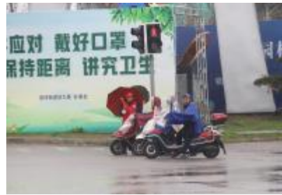
▲志愿者进行交通疏导

整个活动现场充斥着永固志愿者们“人车高峰,注意出行安全”、“人车应礼让”的声音。文明交通看似“小细节”,实则“大情怀”,传递文明,用一点一滴的行动,共建文明城市,同创我们的美好家园。