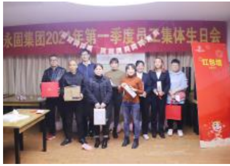
▲游戏获胜队伍抽取奖品

本期讯(雷美芳)为丰富员工业余文化生活,感谢员工辛勤的努力和付出,加强员工之间的沟通交流,不断提升员工的凝聚力和归属感,3月26日,永固集团2021年第一季度员工集体生日会在员工食堂贵宾厅举行,来自各部门的40余名寿星齐聚一堂,共贺生辰。 伴随着悠扬的音乐声,寿星们陆续到场。游戏是让彼此熟悉的最佳方式,主持人的开场白之后,进入了本场生日会的游戏环节。本次生日会共设置了三个小游戏——气球传纸杯、公鸡下蛋和指压板跳绳。寿星们积极参与,玩得不亦乐乎,现场欢声笑语不断。来自不同工作岗位的寿星们,在组队游戏中迅速熟络起来,并