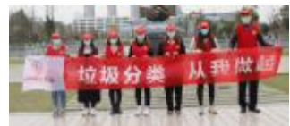
▲志愿者在公园捡拾垃圾

3月14日,永固青年志愿者服务队来到清亲公园清理垃圾,维护良好的卫生环境,用实际行动向大家宣传环保理念。