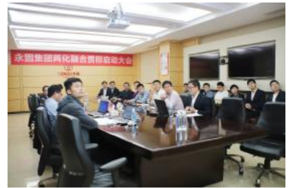
▲“两化”融合贯标启动大会现场