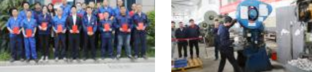
▲部分通过技能等级认定员工合影

此次职业技能等级认定考试是永固自2020年取得职业技能等级认定资格以来第二次自主开展认定工作。面对新的职业等级认定要求,公司相关部门迅速制定职业技能等级认定实施方案,克服认定工作量大、考生多、工种及等级多、时间紧等困难,抽调具有相关技能资质的专业技术人员负责各工种的考评鉴定,确保认定工作顺利开展。为此次职业技能等级认定工作的推进奠定良好基础。