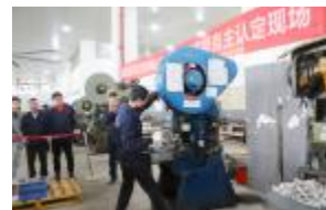
▲职业技能等级认定实操现场

本期讯(雷美芳) 工业化与信息化融合管理体系贯标工作。为了让大家对两化融合贯标工作有个更清晰的认知,便于两化融合贯标工作的开展,两融信息咨询老师还对两化融合管理体系认证工作进行了详细的介绍,并对贯标的背景与意义、日下午永固召开了两化融合贯标启动会,这也是公司“体系月”系列活动的