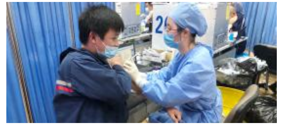
▲上海永固员工集中接种新冠疫苗现场

据了解,注射疫苗是目前新冠肺炎疫情防控最经济、最有效的措施,能够有效降低新冠病毒感染率、重症率和死亡率。下一步,永固集团将继续加大疫苗接种宣传力度,号召更多员工自觉接种疫苗,积极参与抗疫斗争。