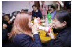
▲气球传纸杯游戏剪影

感受着团队的力量和拼搏的喜悦,也享受着靠团结奋斗赢得奖品的喜悦。 庆生环节,生日歌在耳畔响起,寿星们围着生日蛋糕,闭上眼睛,共同许下自己的生日愿望,感受这份美好与温暖。美味的蛋糕,欢快的笑脸,诚挚的祝福深深地记录在镜头中,定格在每一位寿星的记忆里。 生活需要仪式感,工作需要归属感。永固集团始终践行“幸福为员工”的企业使命,致力于为员工打造温馨友爱、包容奉献的家庭,努力营造轻松和谐的工作氛围,让每一位员工时时刻刻感受着大家庭的温暖,为共建“百年永固”奠定坚实的基石。