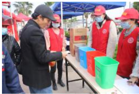
▲行人参加垃圾分类游戏挑战

为进一步深化生活垃圾分类理念,引导群众养成良好的垃圾分类习惯,倡导绿色、低碳、环保的生活方式,3月13日和15日,永固青年志愿者服务队在纬十五路及永固集团公司厂区分别开展了一场“垃圾分类从我做起”志愿活动。